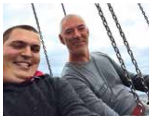
Feuerwehr-Ausflug nach Wien am 26.10.2023